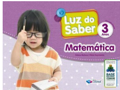
Luz do Saber - Matemática – 3 anos Autores: Eliane Nascimento e Fabiana Barboza Editora Construir