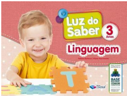
Luz do Saber - Linguagem – 3 anos Autores: Eliane Nascimento e Fabiana Barboza Editora Construir