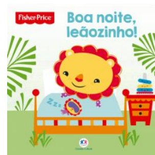
Boa noite, leãozinho! Fisher-Price Editora Ciranda Cultural