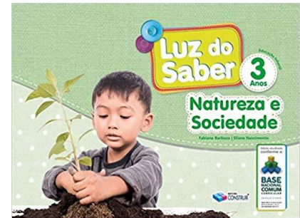
Luz do Saber – Natureza e Sociedade – 3 anos Autores: Eliane Nascimento e Fabiana Barboza Editora Construir