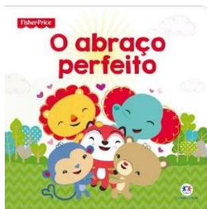
O abraço perfeito Fisher-Price Editora Ciranda Cultural