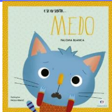
E se eu sentir ... Medo Autora: Paloma Blanca Editora: Ciranda Cultural