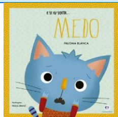
E se eu sentir ... Medo Autora: Paloma Blanca Editora Ciranda Cultural