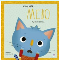
E se eu sentir ... Medo Autora: Paloma Blanca Editora Ciranda Cultural