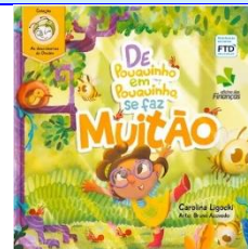
De pouquinho em pouquinho, se faz muito (Ed. Financeira) Autora: Carolina Ligocki Distribuição FTD