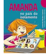
Amanda no país do isolamento Autor: Leonardo Mendes Cardoso Editora do Brasil