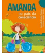
Amanda no país da consciência Autor: Leonardo Mendes Cardoso Editora do Brasil